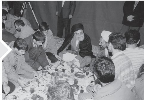
افطاری رهبر معظم انقلاب با فرزندان شهدا، حسینیه امام خمینی در اواخر دهه هفتاد